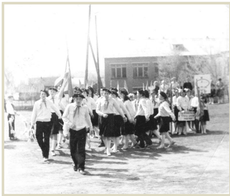
Районный пионерский парад, посвященный Дню рождения пионерии. д. Кварса. 1980-е годы.

Пионеры 80-ых идут маршрутами Всесоюзного марша. Лучшим пионерским отрядам и дружинам присваивалось звание правофланговых. В 1982 году юные пионеры-ленинцы района готовятся достойно встретить 60-летний юбилей Всесоюзной пионерской организации и принимают активное участие в акции «Пятилетка ударных дел». Девиз пятилетки: «Каждому пионерскому отряду – ударное дебло, каждому пионеру - трудовое задание».