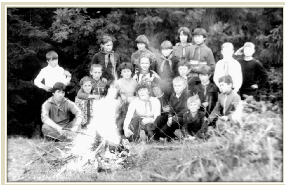
Пионерский костер. Лагерь пионерского актива Воткинского района. д. Кварса. 1982 г.