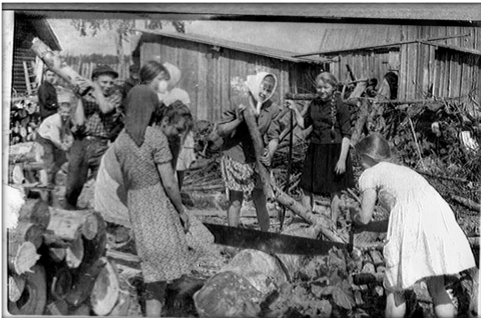
Пионеры Кельчинской восьмилетней школы во внеурочное время заняты общественно-полезным трудом. 1966-1967 учебный год.

В 1962 году пионерскому отряду 8 класса Кельчинской школы было присвоено звание «Спутник семилетки». Это звание присваивалось лучшим пионерским отрядам.